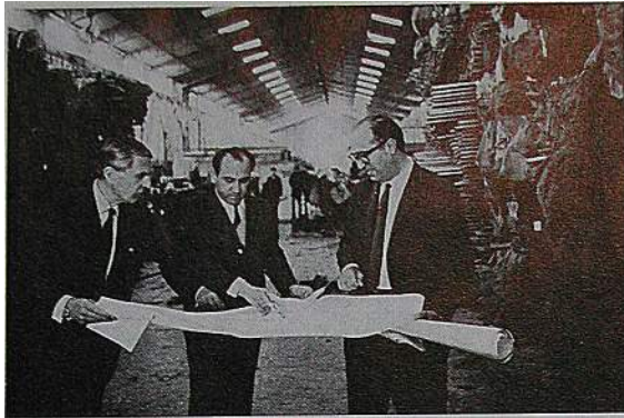
The Government of Iran has established an Industrial Management Institute (IMI) in Teheran for management development and supervisory training. The Institute, which was set up to train managers, functional specialists and supervisors in modern industrial management, methods techniques and organisation, is expanding its activities with assistance from the International Labour Organisation and the United Nations Development Programme.

Partial view of the interior of a steel factory in Iran. The Director of the factory (right, ILO expert E.P.K. Hansom (left) and his Iranian counterpart are looking at plans for a new factory.