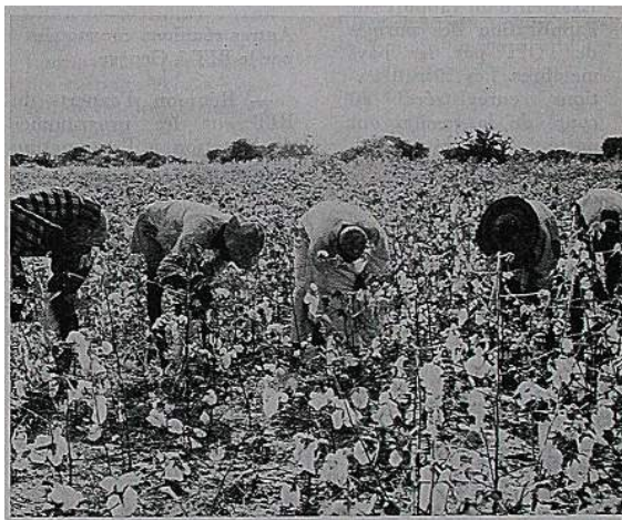
In Eastern Chad, experts of the International Labour Organisation are helping to improve living and working conditions in rural areas. ILO experts — sent at the request of the Chad Government — have established a training centre and clinic at Hourou Angaranà in the Bahr Azoum valley. The ILO centre trains rural instructors and hygienists as well as running courses for farmers in the area.

Picking samples of cotton in a field at the Centre where new plant-varieties are tried out.