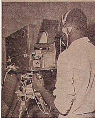
A television trainee from one of the many African nations which sends personnel to France for courses offered by OCORA near Paris. A number of broadcasting stations in Africa and Asia have joined the Society.

al Broadcasting Service into a global NGO should prove" particularly interesting to other organizations especially in view of the problems it had to face during its development.