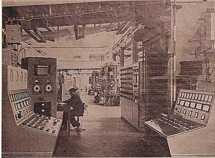
The Society strives to maintain contact with the many industries which serve the broadcasting profession. This is the modern plant of BASF, where magnetic tape was developed in the early 1930's.

groups. For the most part this was due to the independent financial position of the researchers, and the very nature of their work. In 1964, however, it came time to prepare the way for the establishment of a world body which would be controlled by the wishes of its membership. The very greatest of care had to be used during the period of transition to avoid compromise with vested interests.