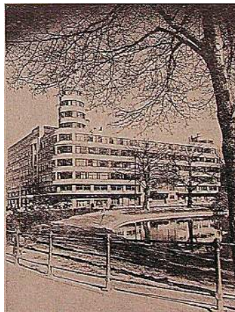
Broadcasting House of the RTB/BRT in Brussels. The International Service of the Belgian Radio was one of the early cooperators in experiments undertaken by the researchers prior to establishing the IBS.

The research organization had been able to conduct its work during these years without reflecting the influences of existing pressure