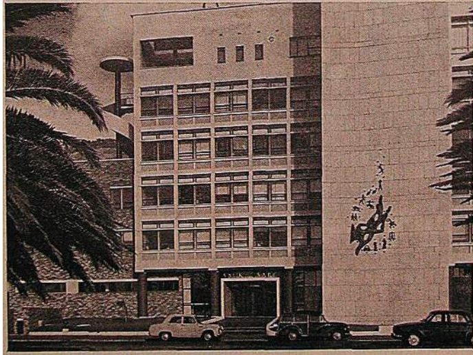
Broadcasting House in Cape Town, South Africa. The SABC was another broadcasting organization which participated in experiments of the researchers. Their transcribed radio programmes proved in high demand.

Looking to the future, the Society has devoted much of its attention to the education of future broadcasters. Several universities in a