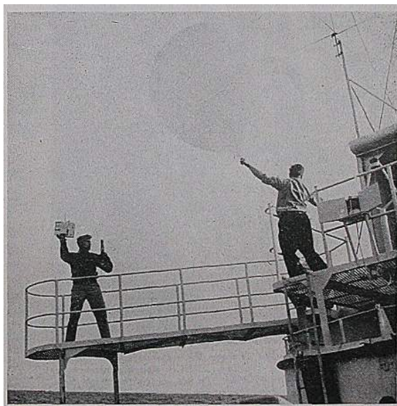
Upper-air observation at sea on board an ocean weather station.

En outre la Commission a traité de questions techniques telles que : les prévisions météorologiques pour les navigateurs et les pêcheurs, l'interaction Océan-Atmosphère, l'établissement des plans de route de navires à l'aide de prévisions à moyenne échéance concernant les conditions météoro-