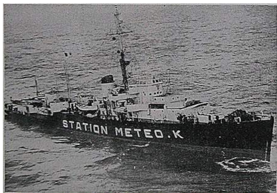
Ocean Weather Station. Weather ships in various oceans make regular weather observations at positions fixed by international agreement to provide continuous data from points essential for air navigation. Shown here is French weather ship K in North Atlantic.