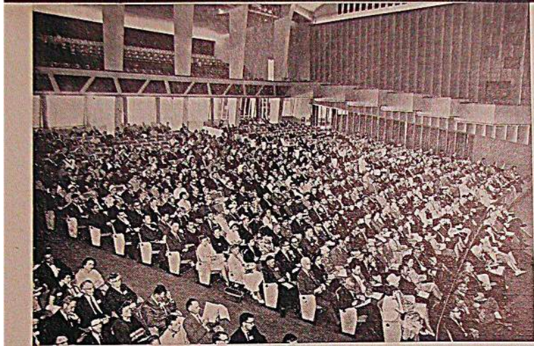
Le XIV e Congrès international de psychologie appliquée s'est tenu à Copenhague du 13 au 19 août dernier. Ci-dessus vue d'une partie de l'assistance au cours de la séance d'ouverture.