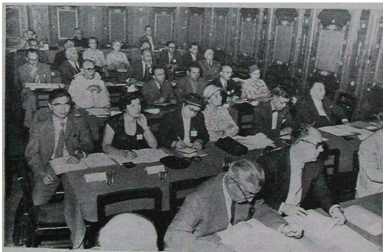
Un groupe de participants à la Conférence des Organisations Correspondantes de l'I.A.I.

certaines essences d'arbres ont trop poussé et que les buissons n'ont pas été soumis à la taille ? Je m'excuse de cette comparaison poétique mais je dois vous avouer que j'aime les jardins et que je reste un fidèle lecteur de la Comtesse de Noailles. Aussi, si mon exposé vous paraît un peu pessimiste, je vous dirais que je crois tellement à la valeur du libre groupement des individus, que j'estime que même dans l'hypothèse où les organisations internationales non gouvernementales viendraient à être complètement étouffées par le développement — heureux par ailleurs — des organisations intergouvernementales, elles seraient en droit de dire avec la Comtesse de Noailles « Ma cendre sera plus chaude que leur vie ».