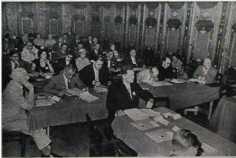
A group of participants at the International NGO Conference, Brussels, 3-4 September 1958.

a faithful reader of the Comtesse de Noailles. Thus, if you consider my statement to be rather pessimistic, I shall add that I am such a firm believer in the free association of individuals that I consider that, even if the international non-governmental organisations came to be entirely stifled by the development — otherwise fortunate — of the inter-governmental organisations, they would be able to say with the Comtesse de Noailles : " Ma cendre sera plus chaude que leur vie ".