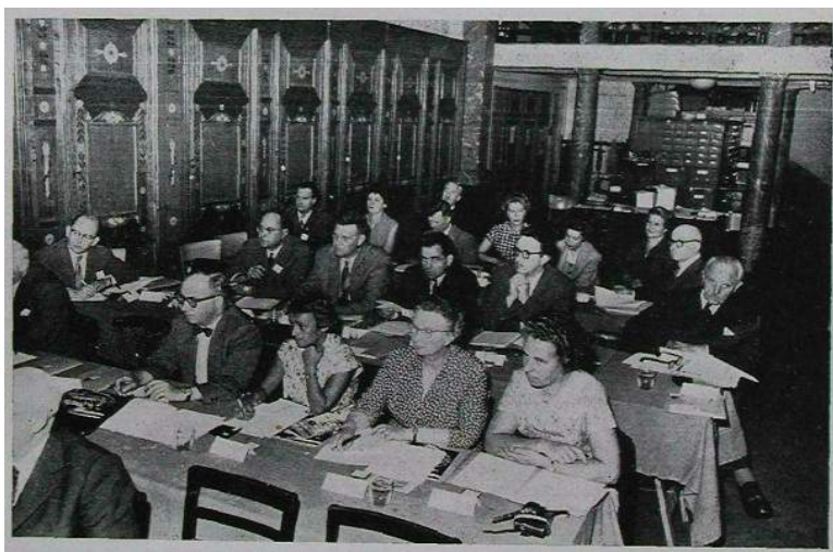
A group of participants at the International NGO Conference, Brussels, 3-4 September 1958.

with some slight modification this applies all through the social or political or whatever fields and in all that we try to do. There is a story about Oxenstierna, Sweden's most famous Chancellor in the 17th century; his son had refused a post in diplomacy, on the grounds that he knew nothing about the work. Father wrote to him saying " My boy, you have no idea with what little wisdom the world is governed ". I suspect that this is as true today as in the 17th century. You, I, our organizations and their member societies can all add something to the sum total of wisdom in the world.