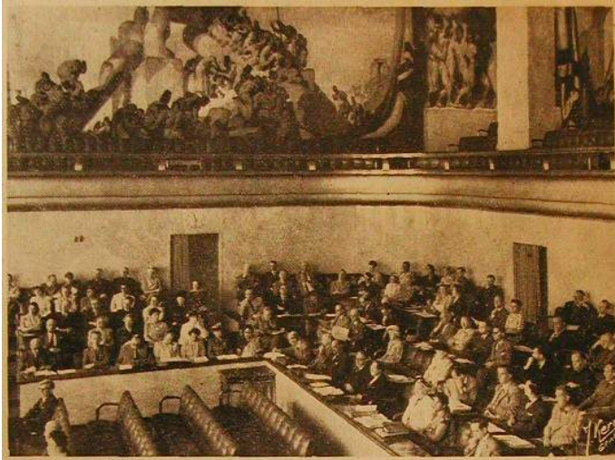
La 5 me Conférence des ONG consultatives tenue au Centre Européen des Nations Unies (29 juin-1 er juillet 1953)