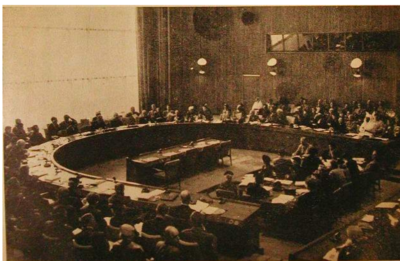
Convening at UN Headquarters in November 1954 for a three-day conference called by the Department of Public Information of the United Nations, more than 200 representatives and observers from Non-Governmental Organizations heard statements by Secretary-General Dag Hammarskjöld and Assistant Secretary-General Benjamin Cohen. This is a general view of the meeting which was held in the Trusteeship Council chamber.