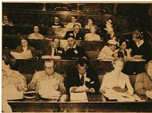
Observateurs d'ONG à la Conférence atomique réunie sous les auspices des Nations Unies, à Genève., en août dernier.

Bock, Edwin A., Representation of Non-Governmental Organizations at the United Nations. Public Administration Clearing House, New York, 1955, 43 pages.