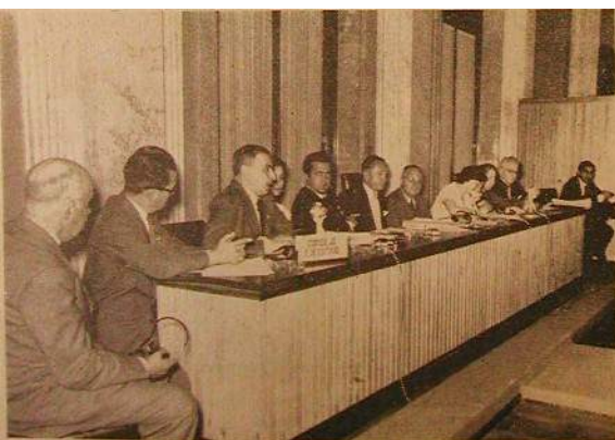
ASSOCIATIONS, 1955, n° 12

Quatre conférences d'organisations non-gouvernementales bénéficiant des arrangements consultatifs auprès de l'Unesco ont été convoquées jusqu'à présent par le Directeur général (Florence, 1950; Paris, 1951, 1952, 1954). Ces conférences ont pour objet de permettre aux organisations consultatives d'examiner en commun toutes les questions relatives à leur coopération avec l'Unesco, et de coordonner celles de leurs activités qui ont trait à la mise en