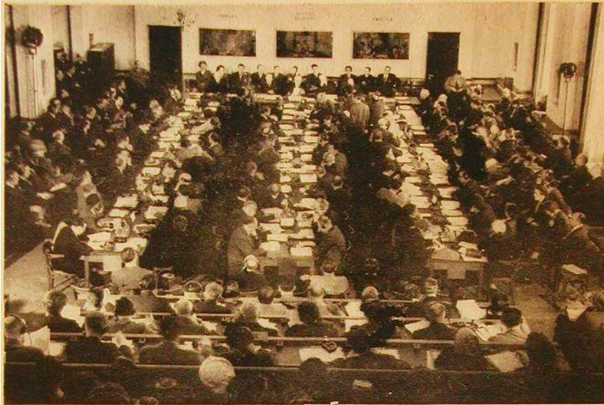
La salle VII de l'Office Européen des Nations Unies, à Genève, durant la Conférence des organisations non-gouvernementales qui s'emploient à lutter contre, les préjugés et la discrimination. (31 mars-4 avril 1955)