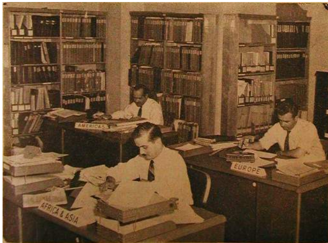
The main research section of the International Civil Aviation Organization's Secretariat keeps aeronautical information relating to the different parts of the world up to date.

Since the closeness of the relationship with ICAO varies with each individual case, some NGOs, whose interests are largely co-extensive with those of ICAO, attend more meetings of