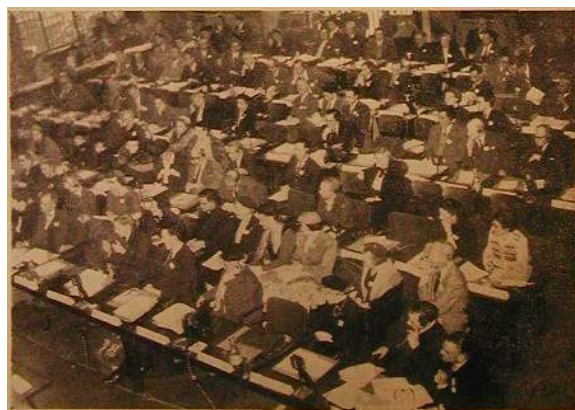
Vue de la salle de réunion, pendant une des séances de la 4 me Conférence des organisations internationales non-gouvernementales, bénéficiant des arrangements consultatifs avec l'Unesco, Paris, février 1954.

B) Les accords en due forme , conclus avec un nombre très restreint d'organisations internationales non-gouvernementales dont la collaboration est essentielle à l'Unesco, garantissent à ces organisations, outre les privilèges découlant de leur admission au bénéfice d'arrangements consultatifs, un certain nombre d'avantages définis par chaque accord : attribution d'une subvention annuelle, octroi de bureaux dans la Maison de l'Unesco services techniques et matériels.