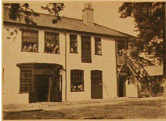
International Help for Children The Little Fond Convalescent Home, near Tilford, England, has provided recuperative holidays for Arab, Belgian, British, French, German, Italian children. Helpers come from Estonia, France, Italy, Norway, U. K.

be true to the character of the World YWCA — a world Christian lay movement, the individual members of which belong to different Christian confessions. It should at the same time be a legal document, a useful instrument providing for further growth and expansion. It became clear also that in order to draw the whole movement more closely together, all affiliated associations should share in the building up of the world movement, and that legislative authority should be spread more widely among the member units.