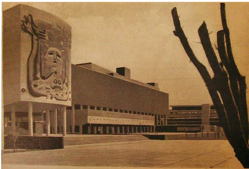
iments de la Cité universitaire près de Mexico, où la 8 me Assemblée Mondiale de la Santé tint ses assises en mai 1955.

The World Health Organization and its relationships with non-governmental organizations. - NGO Bulletin . Vol. V (1953), n° 12, pp. 500-503.